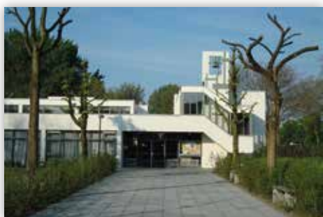
De Open Hof