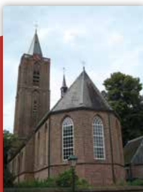
De Oude Kerk